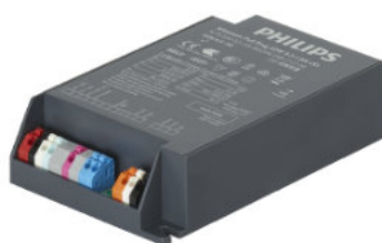
Xitanium Driver DALI