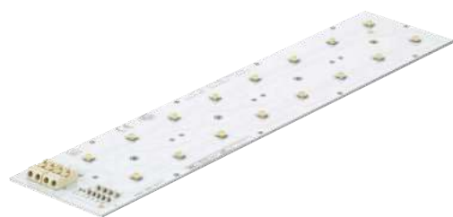
FastFlex LED Board 2x8 DA Gen3