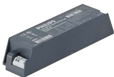
Xitanium Driver 1-10V