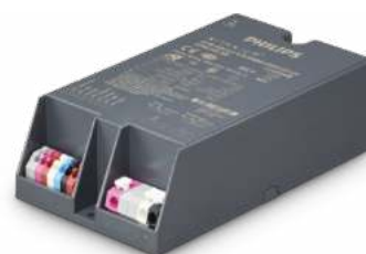
Xitanium Driver SR